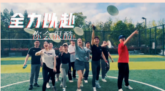
《全力以赴你会很酷》(视频截取画面)